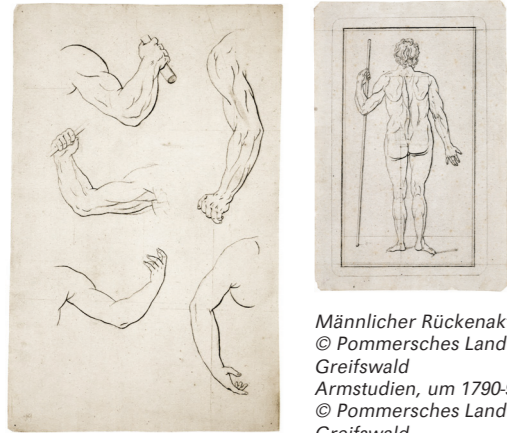
Männlicher Rückenakt, um 1790-94 Armstudien, um 1790-94