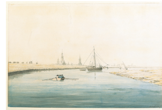
Blick auf Greifswald von Osten, um 1818

Dieses Aquarell entstand auf seiner Hochzeitsreise in die Heimat 1818. Das Motiv ist vom Ryck aus aufgenommen. Vermutlich hat Friedrich seiner Frau Caroline auf einer Flussfahrt seine Heimatstadt Greifswald und die Umgebung gezeigt. Die Sicht ist wegen der nachträglichen Bebauung und Veränderung des Baumbewuchses heute nicht mehr unmittelbar nachvollziehbar.