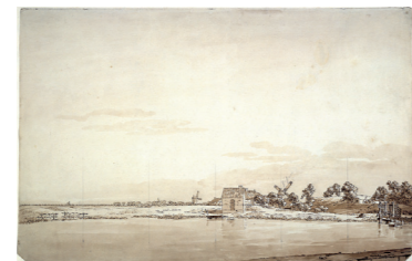
Am Ryck in Greifswald mit Blick auf die Mühlen vor der Steinbecker Schanze, 1801

Auf der lavierten Zeichnung von 1801 setzt Caspar David Friedrich wiederum die Breitendehnung als Element seiner raumgreifenden Bildgestaltung ein. Vom Ryck im Vordergrund geht der Blick zur Bleiche mit Waschhaus bis hin zum Kirchturm von Neuenkirchen im Hintergrund. Auch diese Arbeit hat Friedrich, wie die Quadrierung zeigt, später als Vorlage für ein Ölgemälde verwendet.