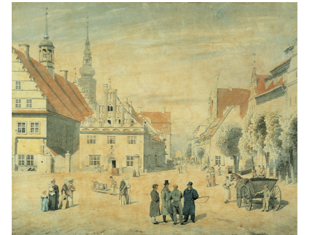
Der Greifswalder Marktplatz mit der Familie Friedrich, 1818