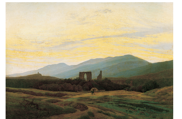
Ruine Eldena im Riesengebirge, 1830/34