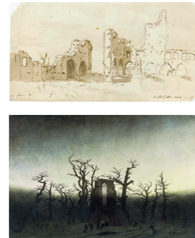
Ruine der Abtei Eldena, 5. Mai 1801 © Staatsgalerie Stuttgart, Graphische Sammlung Abtei im Eichwald, 1809/10 © Staatliche Museen zu Berlin, Alte Nationalgalerie

In Caspar David Friedrichs Schaffen nimmt das Motiv der Kloster- ruine Eldena eine zentrale Stellung ein. Er hat sie auf seinen Reisen in die Heimat wiederholt aus verschiedenen Richtungen gezeichnet und das Motiv mit Naturansichten anderer Gegenden in zahlreichen Gemälden und Aquarellen variiert und kombiniert. Eines der bekanntesten Gemälde ist die „Abtei im Eichwald“ mit der Westfassade der Klosterruine, das Pendant zum „Mönch am Meer“.