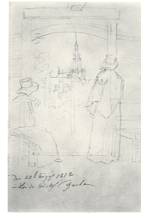
In Bruder Adolfs Garten, 20. August 1818 © Staatliche Kunstsammlungen Dresden, Kupferstichkabinett

Auf Caspar David Friedrichs Hochzeitsreise im Hochsommer 1818 entsteht diese Skizze. Sie zeigt den Blick aus der Gartenlaube von Friedrichs ältestem Bruder Adolf in der Fettenvorstadt auf den Dom St. Nikolai. Die Zeichnung wird Vorlage für das Gemälde „Gartenlaube“ von 1818.