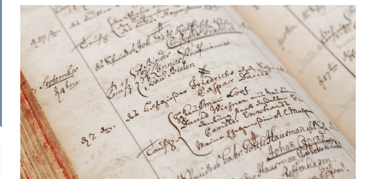
Eintragung vom 7. September 1774 im Taufregister der Domgemeinde