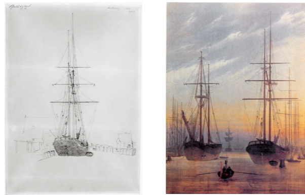
Studie eines Zweimasters, um 1815 Der Hafen, 1815/16

Während seiner Besuche in der Heimat zeichnet Caspar David Friedrich wiederholt den Greifswalder Hafen; angetan haben es ihm die großen Schiffe mit ihren aufstrebenden Masten. Intensiv studiert er die unterschiedlichen Schiffstypen. Während Friedrich den Zweimaster in der Zeichnung links von einem anderen Schiff aus zeichnete, können wir heute das Bildmotiv auf der Steinbecker Brücke stehend beobachten. Diese Studie verarbeitet Friedrich in dem Gemälde „Der Hafen“ von 1815/16.