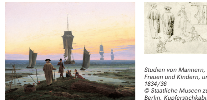
Lebensstufen, um 1835, © Museum der Bildenden Künste Leipzig Studien von Männern, Frauen und Kindern, um 1834/36 © Staatliche Museen zu Berlin, Kupferstichkabinett

Ob Caspar David Friedrich sein Gemälde „Lebensstufen“ hier an diesem Ort, der bis heute Utkiek genannt wird, ansiedelte, kann wegen der topografischen Ähnlichkeit nur vermutet werden. Das Bild symbolisiert das Motiv der Lebensfahrt und spiegelt menschliches Schicksal im Gleichnis der ausfahrenden und heimkehrenden Schiffe. In der Rückenfigur vermutet man ein Selbstporträt Friedrichs, die anderen Personen könnten seine Kinder Emma, Agnes und Gustav Adolf und seinen Neffen Johann Heinrich Friedrich darstellen.