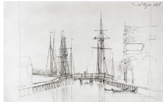
Der Greifswalder Hafen mit Steinbecker Brücke, Tor und Segelschiffen, 1815

Am 10. September 1815 zeichnet Caspar David Friedrich die Steinbecker Brücke aus der Sicht des heutigen kleinen Sperrwerks am Ryck, außerhalb der damaligen Stadtmauer. Auf der Zeichnung ist rechts noch das mittelalterliche Steinbecker Tor zu sehen, bevor es 1820 gänzlich abgetragen wurde. Hinter der Brücke sieht man die zahlreichen im Greifswalder Hafen am Kai liegenden Segelschiffe, die zum Teil etwas überhöht und übertakelt dargestellt sind.