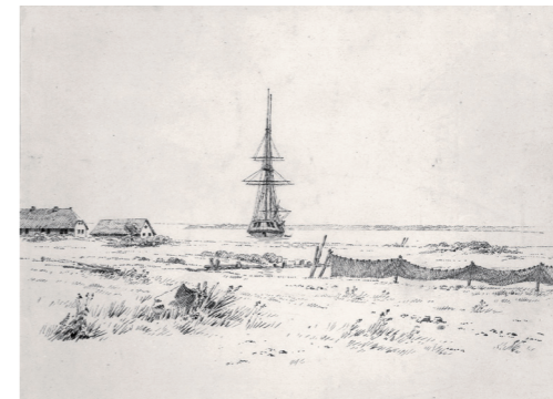
Strandbild mit einer Brigg und Fischernetzen, links zwei Häuser, um 1818

In seinem Skizzenbuch von 1815 hat Caspar David Friedrich im noch unbefestigten Mündungsgebiet des Rycks Schiffe, Boote, Netze und Uferpartien festgehalten. Die Federzeichnung zeigt den Blick vom Ufersaum der Dänischen Wieck bis zum gegenüberliegenden Strand von Ludwigsburg. Bei zahlreichen Gemälden Friedrichs konnten Motive von mehreren bei Eldena und Wieck entstandenen Zeichnungen nachgewiesen werden.