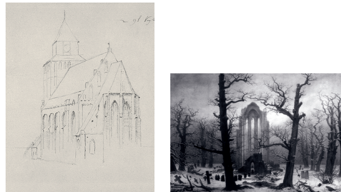
Jacobikirche in Greifswald, 1815 Klosterfriedhof im Schnee, 1819, ehemals Nationalgalerie Berlin (verbrannt)

1815 zeichnet Caspar David Friedrich die Jacobikirche von Südosten mit dem Chor im Vordergrund. Auf einem weiteren Blatt stellt er das Innere der Kirche als Ruine dar. Beide Ansichten verwendet Friedrich auch bei anderen Bildkompositionen; das bedeutendste Gemälde mit einer Innenansicht des verfallenen Chors der Jacobikirche, „Klosterfriedhof im Schnee“ von 1819, ist 1945 in Berlin verbrannt.