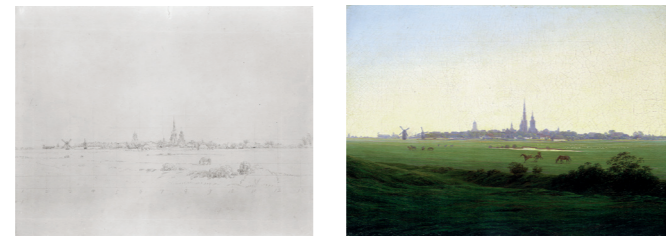
Caspar David Friedrich, Wiesen bei Greifswald (Kuhweide), 1806 Caspar David Friedrich, Wiesen bei Greifswald, 1821/22

Caspar David Friedrich hält in einer Skizze nordwestlich von Greifswald in einem überdehnten Blickwinkel die Silhouette der Stadt mit ihren markanten Backsteinkirchen fest. Der Blick ist durch spätere Bebauungen und Anpflanzungen verändert, aber noch heute zu erleben. Diese Greifswaldansicht wird durch das gleichnamige Gemälde weltberühmt.